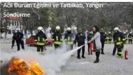
Acil Durum Eğitimi ve Tatbikatı, Yangın Söndürme