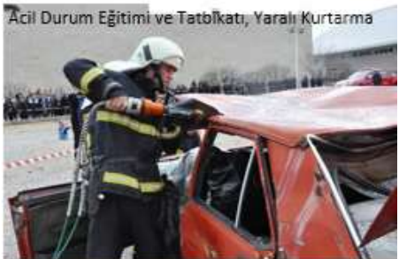
Acil Durum Eğitimi ve Tatbikatı, Yaralı Kurtarma