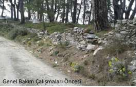
Genel Bakım Çalışmaları Öncesi

16. 883 mezarlık alanının genel temizlik ve ilaçlama işlemlerinin yapılmasından sonra mezarlıkların yerinde inceleme ve tespitlerine göre 2015 yılı programı dâhilinde öngörülen 150 mezarlık alanını tel örgü ile çevirme, taş duvar tadilatları ve parke döşeme işlemleri gibi genel bakım çalışmaları yapılacaktır. Aşağıda yapacağımız işlerin örneği resimler ile gösterilmiştir.