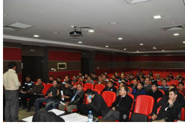
Alt Yüklenici Temel İSG Eğitimi