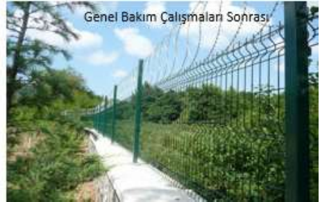
Genel Bakım Çalışmaları Sonrası