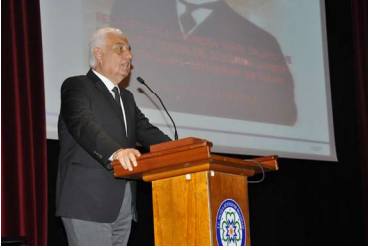
Muğla Büyükşehir Belediye Başkanı Sayın Osman GÜRÜN'ün Açılış Konuşması

Muğla Büyükşehir Belediyesi çalışanlarının (memur, işçi ve sözleşmeli personel toplam 851 çalışanın) %98'nin Temel İş Sağlığı ve Güvenliği Eğitimi tamamlanmıştır. (%2'lik kısım mazeretleri nedeniyle katılamamıştır).