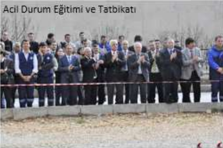
Acil Durum Eğitimi ve Tatbikatı